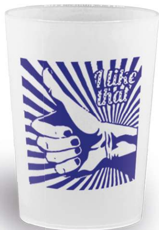
impresión en serigrafía