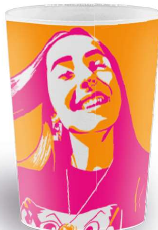
impresión en IML-DG

Vaso para todo tipo de fiestas, conciertos, festivales y cualquier tipo de evento. Ideal para refrescos con hielo, combinados, cubatas. Perfecto para latas de 33 cl.